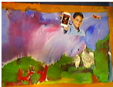
Peinture SAJ Champ-sur-Drac