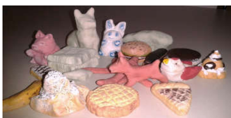
Modelage pâte polymère