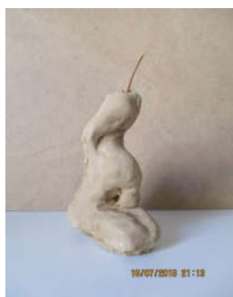
Modelage terre élève