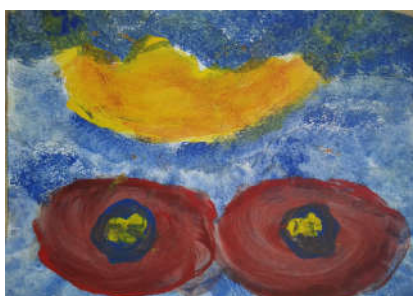
Peinture École Seyssinet-Pariset