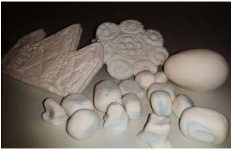
Pâte auto durcissante