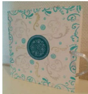
Carte de vœux