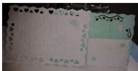
Carte papier maison