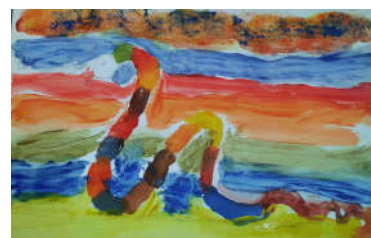
Peinture École Seyssinet- Pariset

Valérie Gras 28 rue Pierre Sémard allée 7 38950 Saint Martin le Vinoux Maison des artiste n° GA05309 - Auto entreprise dispensée d'immatriculation au registre du commerce et des sociétés (RCS) et au répertoire des métiers (RM). Siret : 803 225 879 000 11