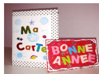
Carte de vœux élève