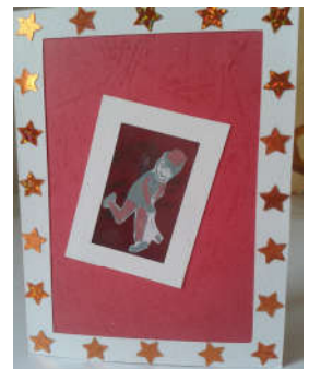
Carte de vœux