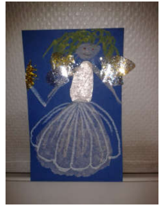
Carte de vœux élève