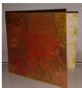
Carte de vœux