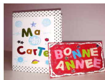
Carte de vœux élève