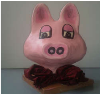
Modelage Papier mâché