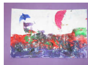
Peinture spatule et pochoir